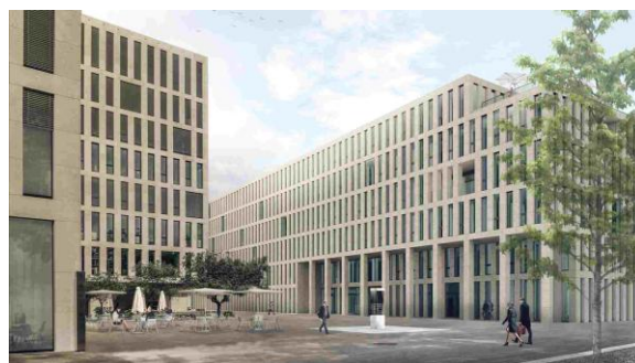
© Office fédéral des constructions et de la logistique (OFCL) / Aebi & Vincent Architekten AG